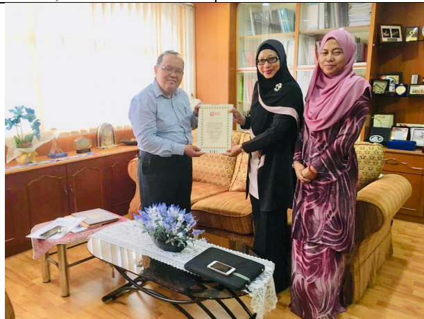
Gambar 7. Penerimaan Sertifikat Penghargaan dari Dekan Faculty of Educational